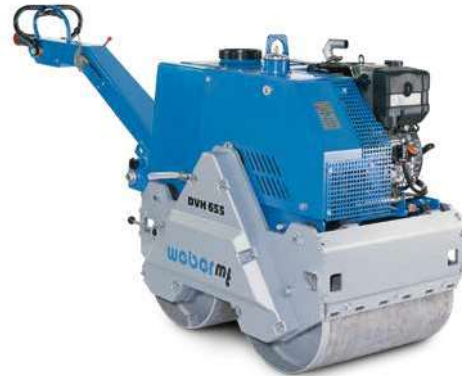
DVH 655 E

Les rouleaux vibrants duplex DVH sont l'instrument privilégié de la construction de trottoirs, pistes cyclables ou petits parkings de stationnement. Ils sont adaptés au compactage de sable, asphalté et gravier. L'entraînement hydrostatique garantit une vitesse réglable en continu.